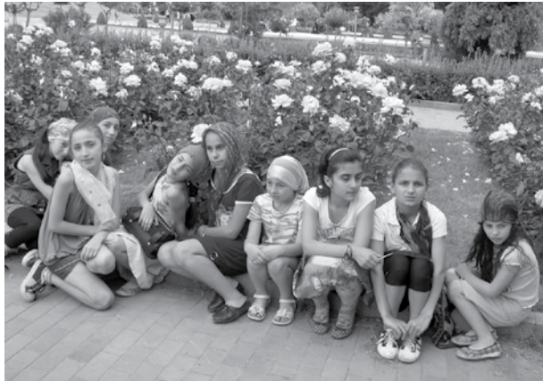
ლია – ამაზე მეტყველებს თბილისიდან თუ საქართველოს სხვადასხვა

მახათას მთა – ულამაზესი ხედით ქალაქზე და უფრო მშვენიერი და ამაღლებული მისიით – აქ აღიმართება ივერიის ყოვლადწმიდა ღვთისმშობლის ხატის სახელობის ტაძარი. ხავერდოვანი მწვანით დაფარული ველი და წარწერიანი ქვების გროვა – ტაძრის საძირკვლისათვის. ყველა ქართველს, დიდსა თუ პატარას, უწმიდესის მონოდებით თავისი წვლილი შეაქვს უდიდეს ქართულ საქმეში, საშვილიშვილო საქმეში, რომელიც ერის გამთლიანებისა და „ერთ სულ და ერთ ხორც“ შეკვრის წინაპირობაა. ამ მთას და აქ არსებულ უკვე მოქმედ ტაძარს მლოცველი არ აკ-