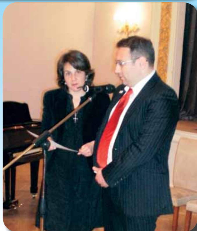
ბიულეტენი გამოდის ცხუმ-აფხაზეთის მიტროპოლიტ დანიელის (დათუაშვილის) ლოცვა-კურთხევით 2007 წლის ივლისიდან