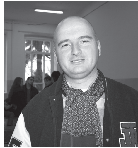
ჰქონდეთ სათანადო მიმართულების ექსპერტებთან. საქართველოს პოლიტიკოსებს ეს კავშირები არ აქვთ და როცა ამომრჩეველს არაფერს არაფერს ათავაზობს, არჩევანს პიროვნებებს შორის აკეთებს. აი, ეს არის პრობლემა, რომელიც მხოლოდ ამომრჩევლის ნინამე არ დგას. ის ერთნაირად უნდა აწუხებდეს ხელისუფლებასაც, ოპოზიციასაც და სამოქალაქო საზოგადოებასაც.

გავითვალისწინოთ ისიც, რომ თუ ერთეულებს არ ჩავთვლით, ქართველი ინტელიგენცია თითქმის არ მონაწილეობს ამ პოლიტიკურ პროცესში. ვინ უნდა მოამზადოს, ვთქვათ, საგარეო პოლიტიკური კონცეფცია? პარტიის წევრები ამ საკითხებში შეიძლება არ იყვნენ ჩახედულნი, ამიტომ მათ კავშირი უნდა