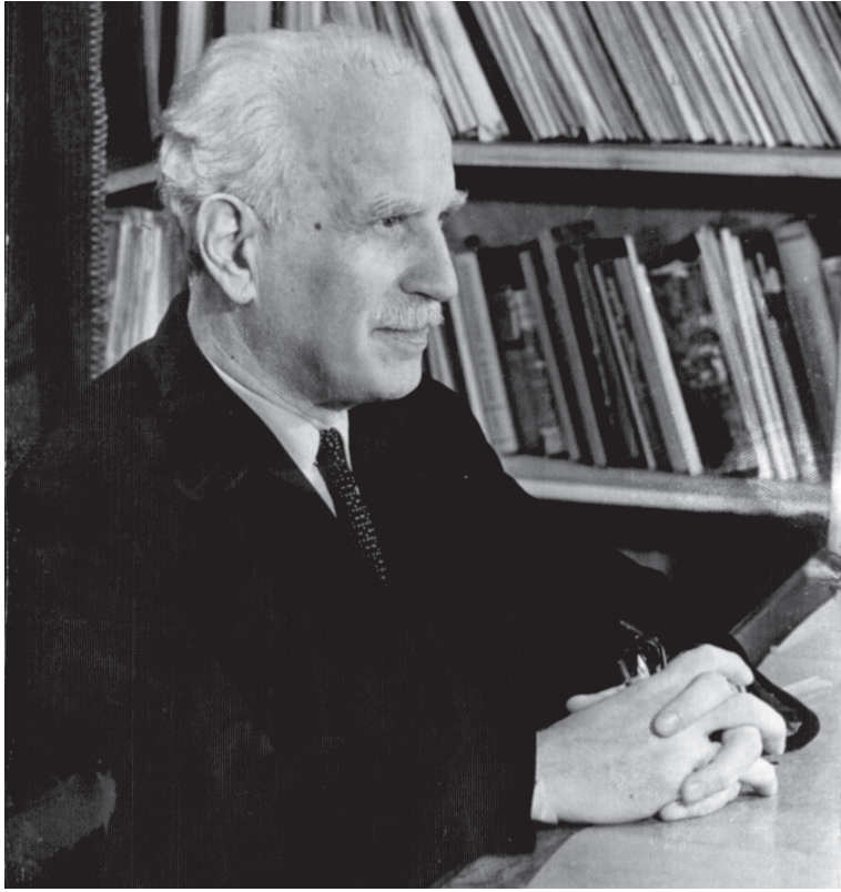
24 მარტს ივანე ჯავახიშვილის სახელობის თბილისის სახელმწიფო უნივერსიტეტში ჰუმანიტარული ფაკულტეტის კავკასიოლოგიის ინსტიტუტის თაოსნობით ცნობილი ქართველი ენათმეცნიერის არნოლდ ჩიქობავას დაბადებიდან 110 წლის იუბილე აღინიშნა. ღონისძიება აკადემიკოსის ცხოვრებისა და მოღვაწეობის ამსახველი ფოტო-გამოფენით გაიხსნა, რომელიც ივანე ჯავახიშვილის სახელობის დარბაზში გამართული სამეცნიერო სესიით დასრულდა.

თსუ-ში არნოლდ ჩიქობავას დაბადებიდან 110 წლის იუბილე აღინიშნა