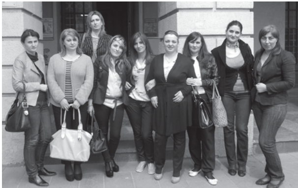
აფხაზეთის ფინანსთა სამინისტროსა და განსაკუთრებულ და-

ვალებათა საკითხებში აფხაზეთის მინისტრის აპარატის თანამშრომლებს მოვუწყვეთ ექსკურსია საქართველოს ერთ-ერთ უმნიშვნელოვანეს კულტურის კერაში — ეროვნულ მუზეუმში. აქ დაარსების დღიდან თავს იყრიდა საგანძური, რომელიც საუკუნეებს ითვლის. სამი დღის მანძილზე შესვენების საათებში ცენტრის თანამშ-