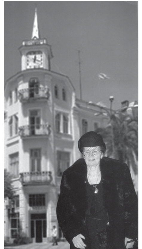
კიდევ დიდხანს ყოფილიყოს იმედიანობისა და სამართლიანობის მაგალითი.

გულითადად ვულოცავთ ქალბატონ თათუმას 85 წლის იუბილეს. ვუსურვებთ ჯანმრთელობას და ჩვეულ შემართებას.