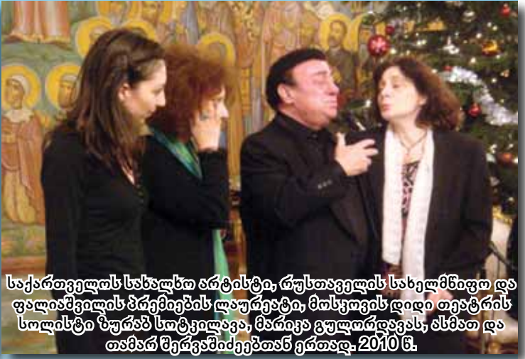
საქართველოს სახალხო არტისტი, რუსთაველის სახელმწიფო და ფალიაშვილის პრემიების ლაურეატი, მთხოვის დიდი თეატრის სოლისტი ზურაბ სოტკვილაჟინი, მამუჯინი გულთღვაჟინი, მამუჯინი და თამარ მენთლოჟინი. 2010 წ.