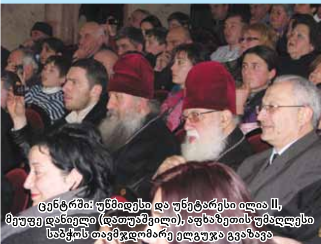
ცენტრში: უნივერსი და უნივერსი ილია II, მეფე დანიელი (დათუაშვილი), აფხაზეთის უმაღლესი საბჭოს თავმჯდომარე ელგუჯა გვაზავა