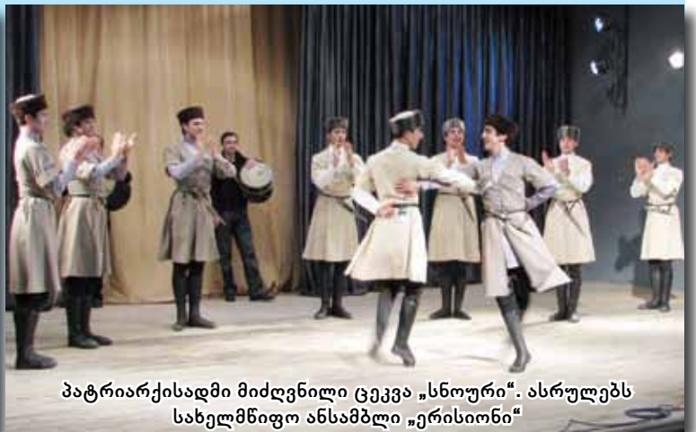
პატრიარქისადმი მიძღვნილი ცეკვა „სლოური“. ასრულებს სახელმწიფო ანსამბლი „ერისიონი“