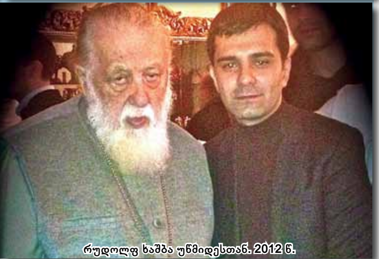
რულოლოჟინი ნამუჯინი უნმოდესთან. 2012 წ.