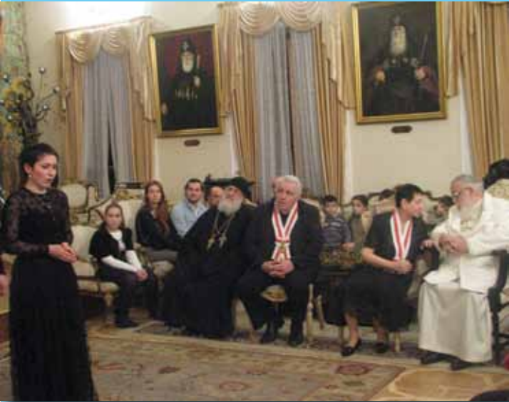
პატრიარქის დახვედრის დღის მომსახ. 2012 წელი