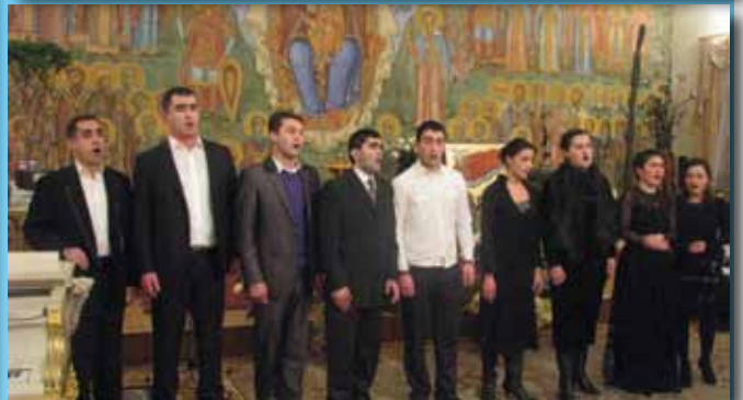
დღის დღის აღსანიშნავი სადამო საპატრიარქოში. 2012 წელი