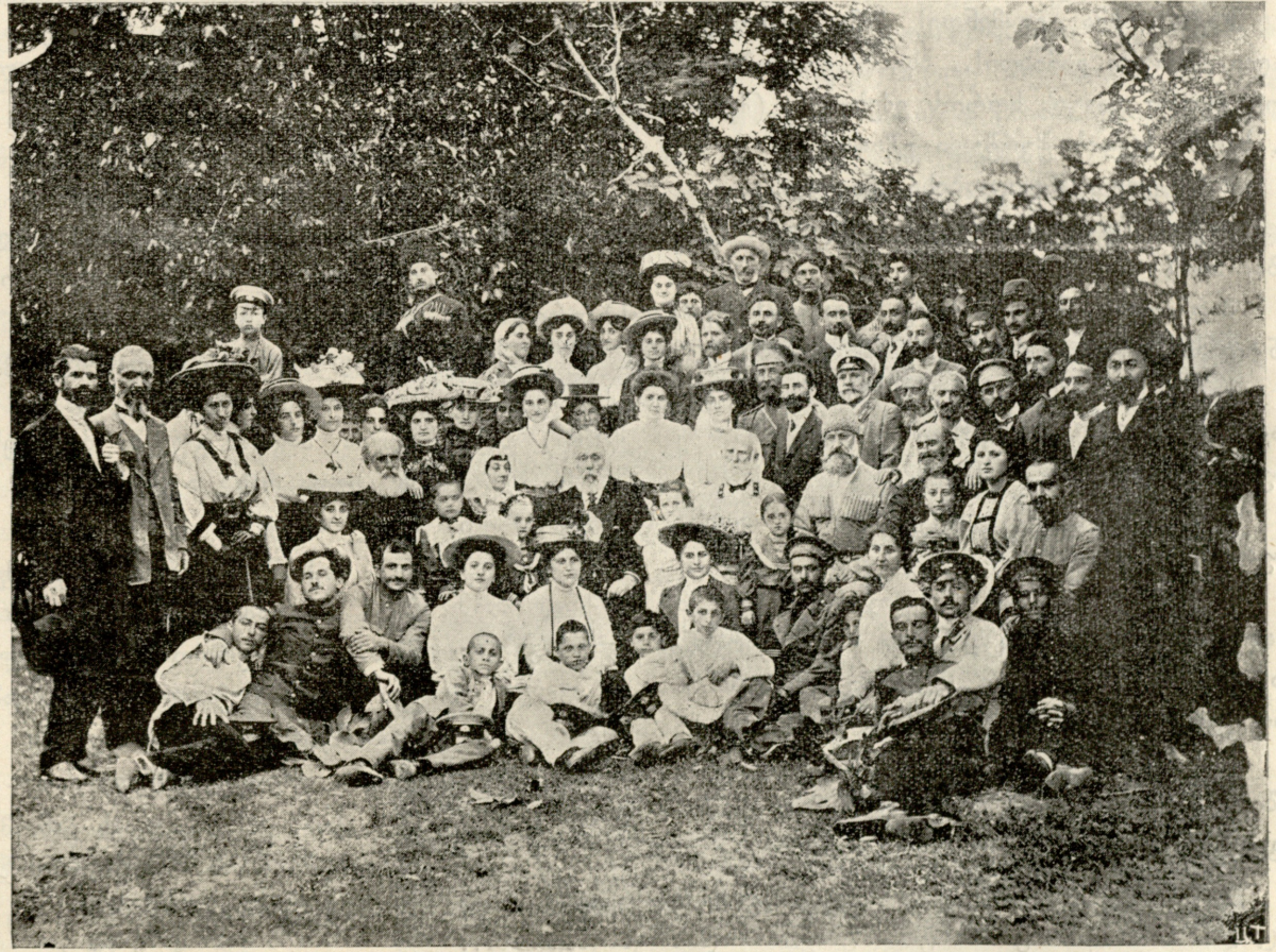
აკაკის გაცილება ხონელების მიერ.

საქო. ბიჭო, შაქრო! სად განაბას დაიშალე? გამოეხირე, შე ყურუმსალო, ეზო დაგვე! შაქრო. (დუქნიდან) ე ტიალო ბიჭკას გასდის და არ დაუცვა?!.. საქო. აი, შე არამზადე! შენ თუ რამე არ გააოხრე, ხომ არ მოისვენებ. ბოქკას რა სკირდა... ვიცი, შე პირშავო, დაახეოქებლი მიწაზე... ვა, დედამიწას არ ასცილებიხარ, გული ყელში გჩრია, ბრაზისაგან სქლები. არა, რომ გაიზღები რალა იქნები? შაქრო. კრანტი მოშვებული ქონია ამ ვერანას და ჩემი რა ბრალია! საქო. აქ გამოდი, გამოეხირე... შე ჩემი ცოდით სავსე... შაქრო. (გამოვა, ცოცხი ხეღში უჭირავს) ხაზენ, ე ჩუტები კი აღარ მაცვია და რითი უნდა ვიარო? საქო. ჰო, პაპაშენს აქვს ცხონება, შიგრინის ბაშმაკებს მოგართმევ! არა, შინაც ქუსლიან წაღებში დაბანდებოდა!.. ახმან, ახლა დოხტურები ამბობენ და მდიდრებსაც ურჩევენ,