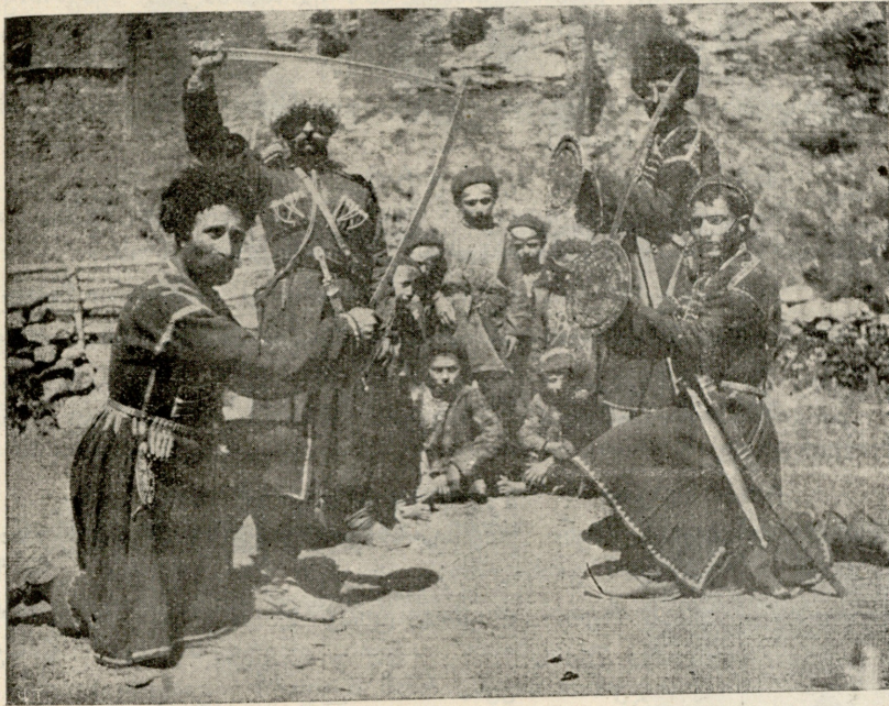
კანანაობა (ხალხი ვარჯიშობა) ხმელთაშუაში.

საქო. შენც კრალა დაულაგე, ვინცის, რა არა უთხარი.