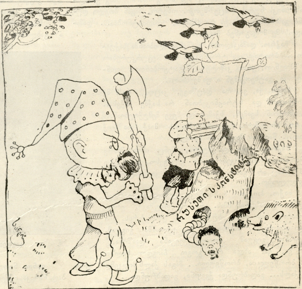
რუსეთის კონსტიტუცია (ტირის). ათასწილად სიკვდილი სჯობს, ამათ ხელში ჩაეარდნასა...

ნატ. არხეინათ იყავი!.. რა მჭირს მე, ყველა გაიძახის, რა ბედნიერიაო. რა ქმარი შეირთოო, ვაჟი კაცი, მდიდარი მამულიშვილიო... ახლა ჩემ გულში ჩაიხედეთ. ოხ, მამა ჩემო! ჩემი ცოდვით მოისვენებ შენ? „ვის რათ უნდივარო?“ შენ თავისუფალი მაინცა ხარ და მე?.. მაგრამ ვინა გვკითხამს ჩვენ? საითაც გადიქნევენ, ით უნდა გადიხარო... უიმე ქა! ვიღებებიც მოდიან (სწრა-