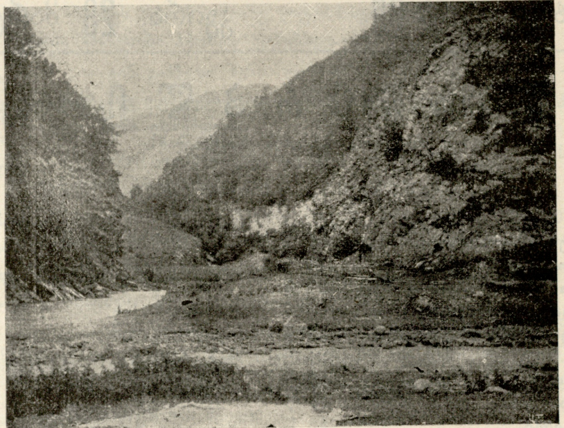
ორ-წყალა, ხმესურისა და ფშავის არაგვის შესართავი.