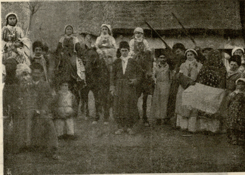
ინგილოური ქორწილი: ქალაღია ჩამოფარებული პატარძალია, აქეთ-იქით ამხანაგები უდგანან, რომელთაც, ჩვეულებისამებრ, წინ ჩამოფარებული აბრეშუმის თავშალი უჭირავთ. ცხენზე აქენები* (ქალის მაყრები) სხედან, ორი მაყარი თოფს ისფრის. ის წუთია გაღალბებული, როდესაც ჯვარის, საწერად ეკლესიაში მიჰყავთ.

სარდიონ. მერე რაღა!.. რომანმა მიიღო ჩვეულებრივი მიმდინარეობა... თამარი რომ ჰუჩანს გამოერკვა, საშინ-