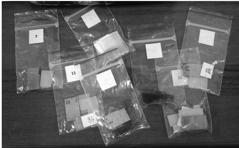
დარიშხანის ნარჩენების ნარჩენების გადამუშავებით შესაძლებელია მაღალი სისუფთავის დარიშხანის მნიშვნელოვანი ნაერთების, მათ შორის, თეთრი დარიშხანის, მეტალური დარიშხანის და მრავალი სხვა ღირებული ნაერთის მიღება, რომელთა შემდგომი გარდაქმნით მიიღება სხვადასხვა რეაქტივისუნიანი ნაერთები და მათ ბაზაზე კი საინტერესო პრეპარატები და მასალები. ჩვენ, მაგალითად, რამდენიმე ისეთი კომპოზიცია შევიმუშავეთ, რომელიც გამოყენებულია სამუხუმო ექსპონატების ანტიბაქტერიული და ანტიმიკრობული დაცვისათვის. ასევე, შეიძლება დავიცვათ არქეოლოგიური ნიმუშებიც...

საწარმოო ნარჩენების და მეორადი ნედლეულის უტილიზაცია და მიზნობრივი გამოყენება ნებისმიერი ქვეყნის მნიშვნელოვანი ტექნიკურ-ეკონომიკური რეზერვაა.