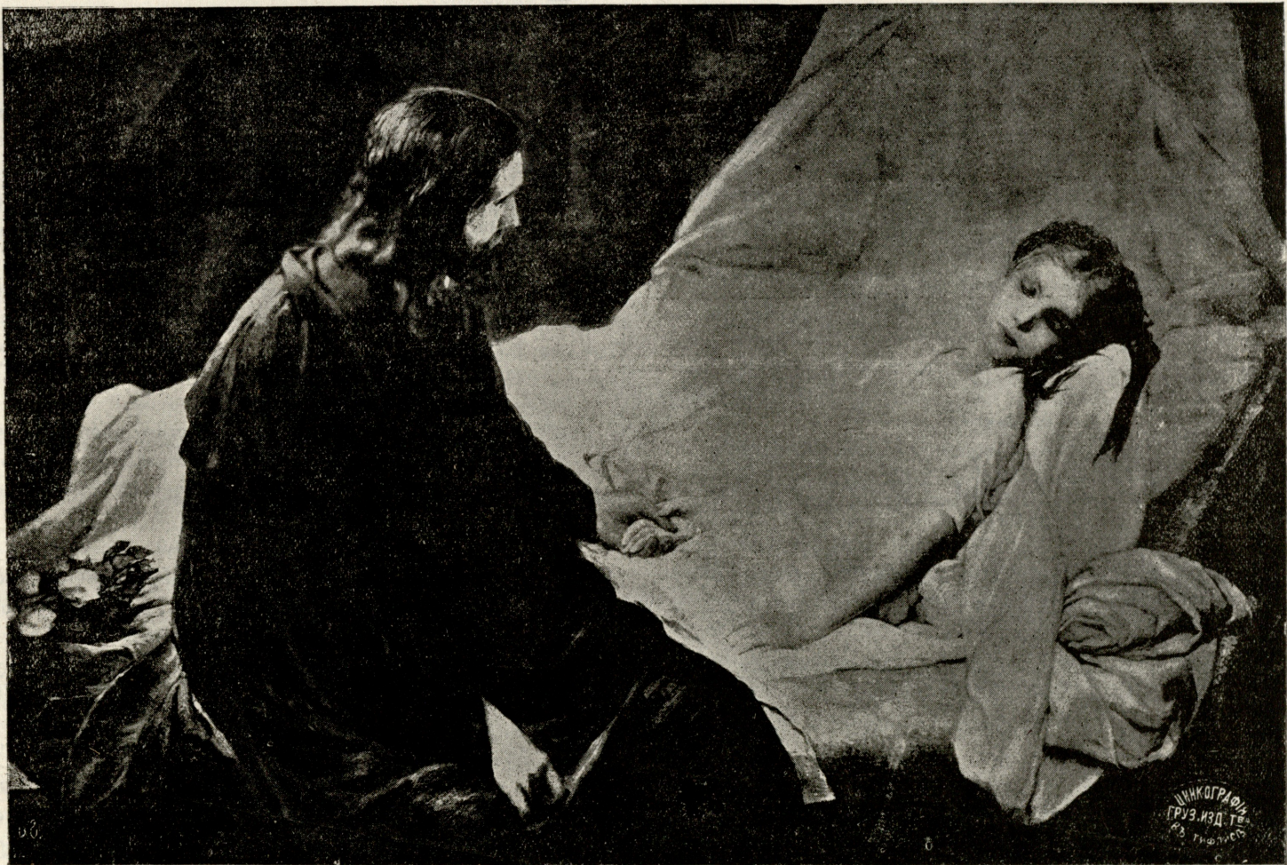
ქრისტე ავადმყოფთან. ნახატი კრამსკისა.

საქართველო წიგნების კავშირი საქართველო საზოგადოებრივი დაწესებულების გაზეთის № 783 დაგეგმვის № 137 სამშაბათი, 25 დეკემბერი 1912 წ.