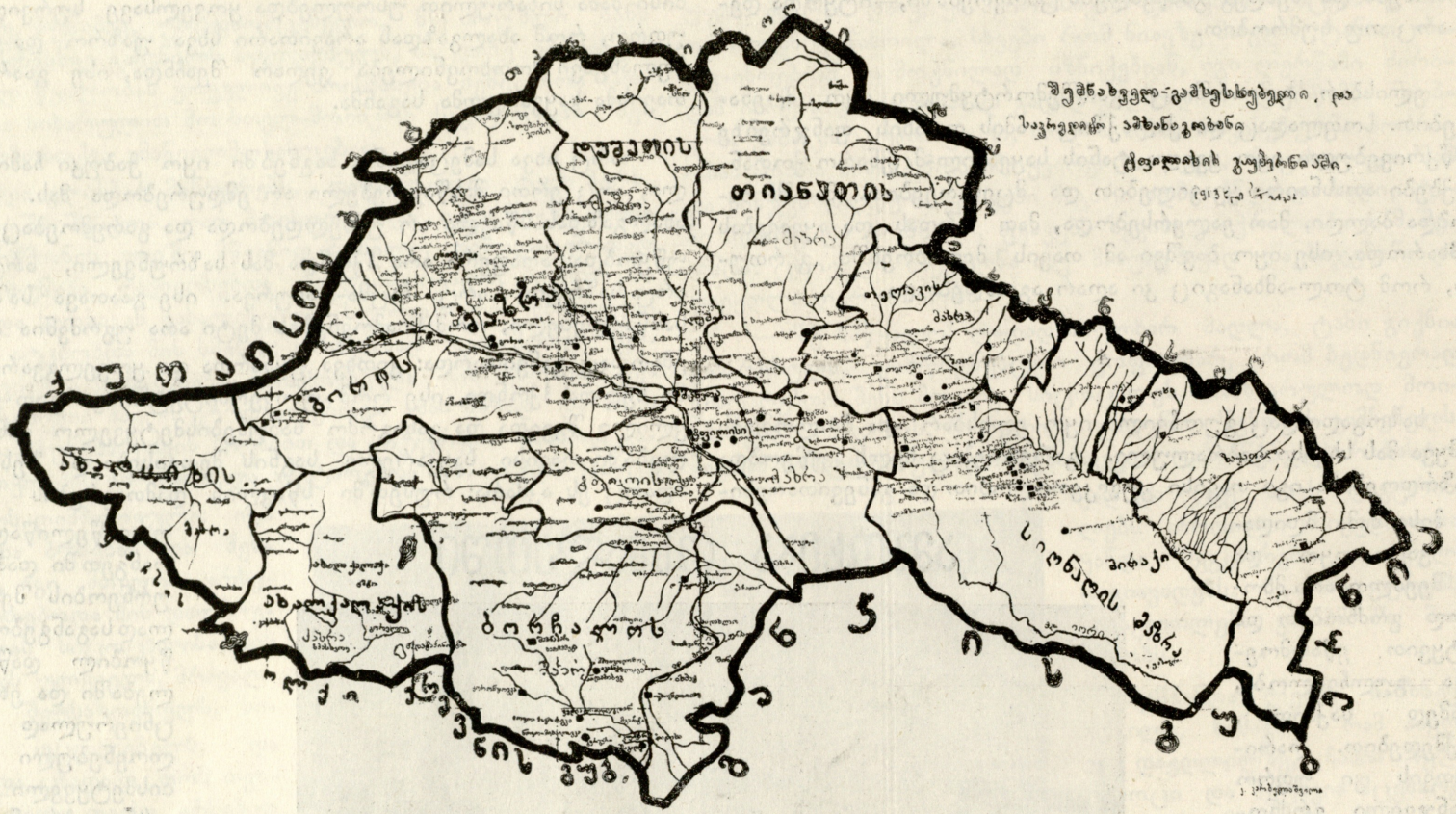
შემთავრებული-გამოსახლებული რაიონების რუკა საქართველოში, ავტონომიური რეპუბლიკის ტერიტორიაში. 1935 წლის მდგომარეობით.