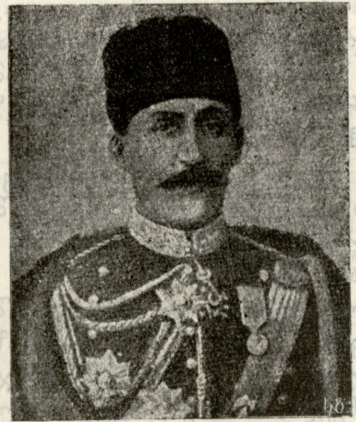
შუქრი-ფაშა — („ლაზი“, უძლეველად წოდებული). აღრიანოპოლის ციხის უფროსი.

ლიყო ან ვისგანმე შესაბრა-ლისი, როგორც გრძნობდა ამას ახალგაზდა. ქალის მამა გიმნაზიის მასწავლებელი იყო, მკოდნე ოსტატად ითვლებოდა მიჩნეულად, საკმაო ჯამაგირს იღებდა და ცხოვრობდა სუფთად. მართალია, ძლივსა ჰყოფნიდა ფული, სხვა სამუშაოს აღება-ცა სჭირდებოდა, რომ გასძლოლოდა ცხოვრების მოთხოვნილებებს, მაგრამ ეს მხოლოდ იმისთვის, რომ ყველაფერი სასყიდი იყო, ცხოვრება კი უნებლიეთ ისე ჰქონდა მოწყობილი, როგორც ვისმე შემძლებელს. თუ რამე შემთხვევითი და მოულოდნელი ხარჯი დააცდებოდა ოჯახს, ეს კი ძირიანად არყვედა მის კეთილდღეობას. იყო ზურაბ ციაგიძის ცხოვრებაშიც ისეთი ხანი, როცა იმედი ჰქონდა მას რამე მამულის შექმნისა და თავშესაფარის მოპოვებისა, მაგრამ ტკბილი ოცნება ოცნებადვე დაურჩა, ვერ განუხორციელდა სურვილი: ქულფათი დაეხვია, მეუღლე