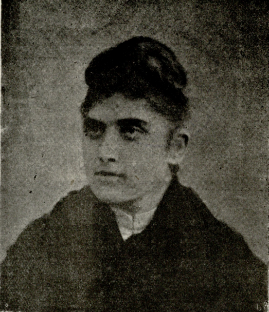
მსახიობი ქალი ბარბარე ნებიერიძისა. († 1913 წ. 4 თებერვალი.)

პურის ძებნა, რომელი აღმოცენდება ეკალთა და კუროსთავთა შორის და რომლის ამოღება უწყლავს მათ კანს, უსისხლიანებს. რამდენადაც მშვენიერი არიან ეს არსებანი, იმდენად სუსტნი და უმწეონი. ესეთნი არიან ცოდონი, თორემ სხვებს რა უშავთ, თოქმად ნაშენ-ნაგებთ ან ტლანქად ჩამოსხმულთ?! ისევე ვერას დააკლებს მათ ცხოვრების სიღუბტირე, როგორც ბუნების სიძვე ვერ ჩააქნობს და მოაშთობს რომელსამე ეკლად ამოსულს, ღერო დაკუჭრებულ, გაბარჯლულ მცენარეს, რომელიც მძლავრად ჩაჰკვრია მიწას და