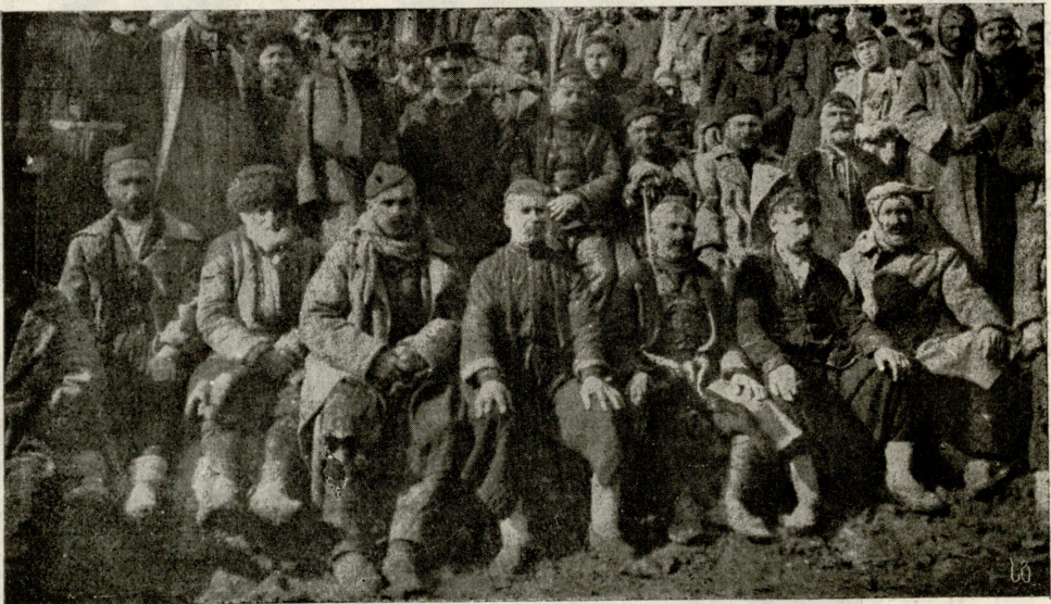
მარტყოფის მერძევეთა ამხანაგობის დამფუძნებელთა საზოგადო კრება. (იხ. ლღვეანდელი გაზეთი).

თვით ქვეყნის დამწველ გვალვაშიაც პოულობს საკმაო სიჩინტეს და სინოტივეს. ჯაბუკის გონების თვალწინ ერთად აღიმართნენ, ერთმანეთს აეტოლნენ, მისგან ნანახი დამზნეული ლერწამი და ეს მინახებული ქმნილება, რომელიც აგერ მიეფარა მის თვალთაგან, და ძლიერ მოესურვა ნება ჰქონოდა