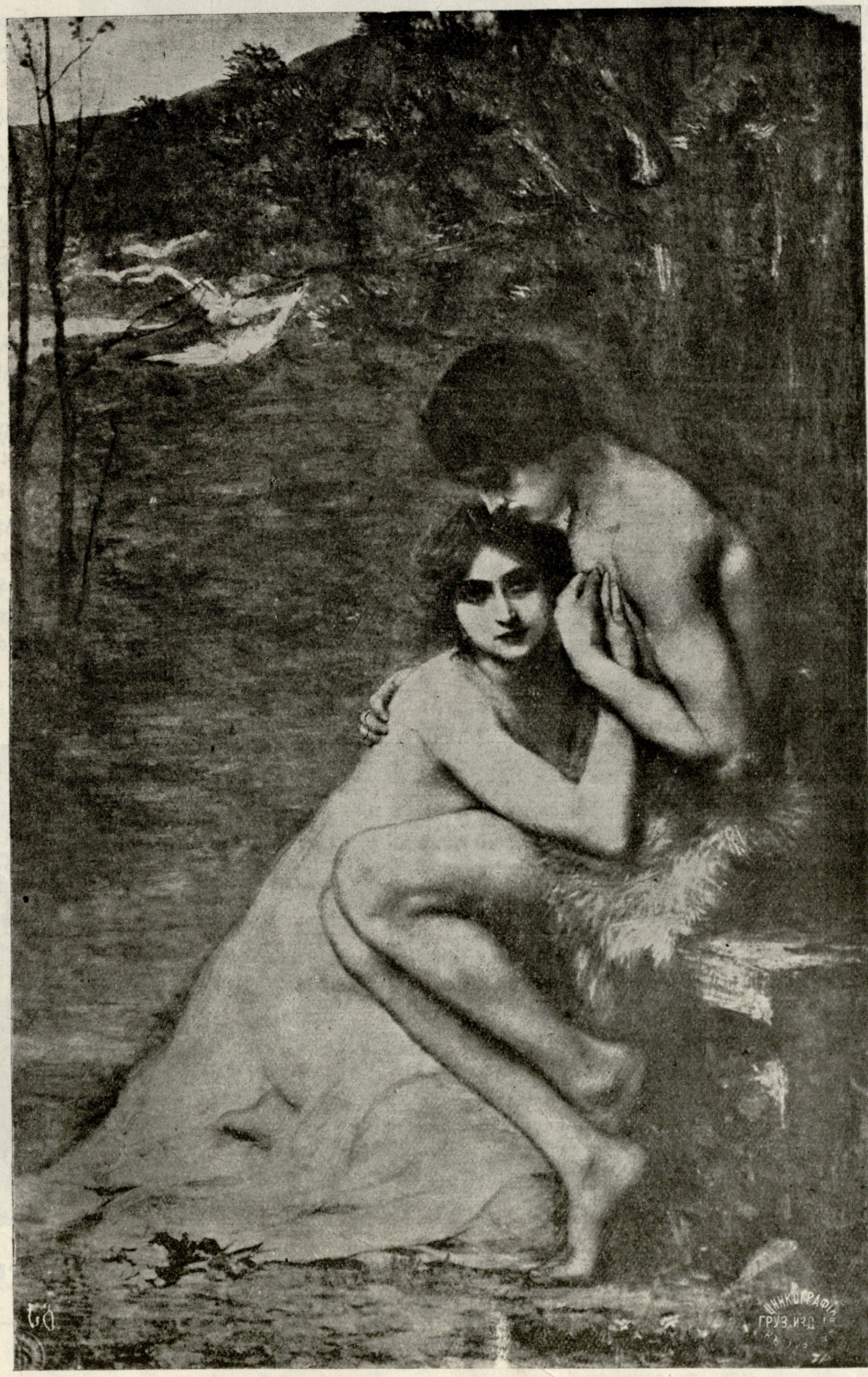
ადამ და ევა.—ნახატი ლიუსენისა.

— რას იტყოდა ი ქალი ან რას იფიქრებდა! მივდიოდი ბრმაბრმად, ცისკენ მიმეპყრო თვალები და კინაღამ ზედ წავაწყდი ი საწყალს. იქნება ეგონა, ხის წვერებზე ყვავებსა სთვლის ე ვილაც პირდაღებული უსაქმოვო. ან იქნება გაიფიქრა, ქალთ მაძიებელი ვინმე ქარაფშუტა არის და განზრახ მოვიდა ზედ, რომ ხმა გაცეა ჩემთვის, ანკესი გადმოგედოვო,—გაიფიქრა ვაჟმა.