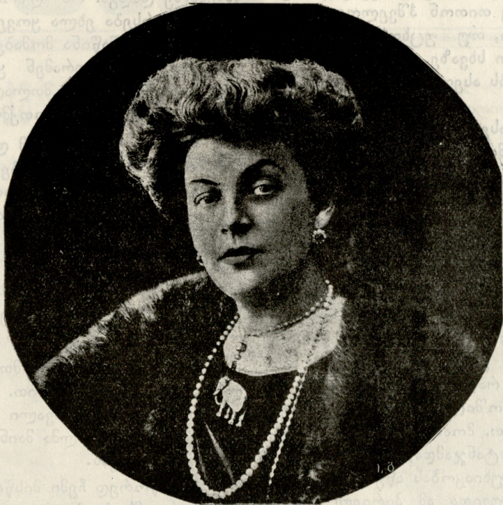
მომღერალი ქალი ა. დ. ვილცევისა.