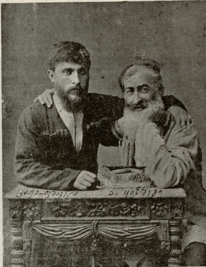
ა. ყაზბეგი (მოჩხუბარიძე) (მარჯვნივ) მისი გარდაცვალების 20 წლის თავის გამო და მისი მეგობარი ვაჟა-ფშაველა.

— მიეჩვევით, მამაო, მი...ე... ჩვევით, გააგრძელო დათაია დიაკვანმა,—ნათქვამია, ბატონო, თევზს თავიდან დაიჭირნო. ყოვლისფერ საქმეში ასეა. ყოვლისფერი საქმე თაიდან უნდა დაიჭირო. ამასთან ხერხი უნდა ყოვლისფერს, ყოველ საქმეს ხერხი ესაჭიროება. თქვენ მამაო, მართალია, ნასწავლი კაცი ბძანდებით, მე კი... ჰა! საღდაც ნამარნევის მონასტერში ერთი ორი ალილუისთვის მომიკრავს ყური, მაგრამ გამოცდილებით, აქი თქვენც მეთანხმებით... ოც და ხუთი წელიწადი გავიდა რაც აქ „პრიჩეტნიკ“-ადა ვარ და რაღა გასაკვირველია, რომ აქაური ამბები „მამაო ჩვენო“-სავით ვიცოდე. თქვენი მაკურთხებლის წმიდა მარჯვენას გეფიცებები, რომ ჩემისთანა სიმართლეს აქ არავინ გეტყვის. არც გასაკვირველია! ჩვენ ორთავენი ერთ საქმეს ვემსახურებით... ჩვენი ინტერესები, ბატონო, ასეა, დიაკვანმა ორივე სალოკი თითი მოკაკვა და ერთმანეთს გადააბა... მე აქ, მამაო, თვით სატანა რომ ამოიყვანო ქვესკნელ-ჯოჯოხეთიდან ის ვერ გამაცურებს... ოცდა ხუთი წელიწადი