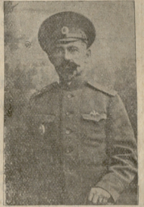
პოლკ. თავ. ნ. ხიმშიაშვილი (მოკლულია)