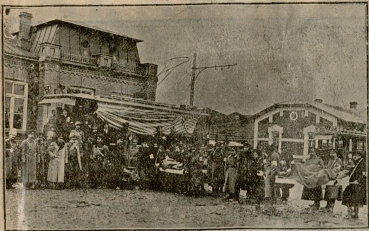
ნავთლული. მძიმედ დაჭრილ მეომართა გადმოყვანა.