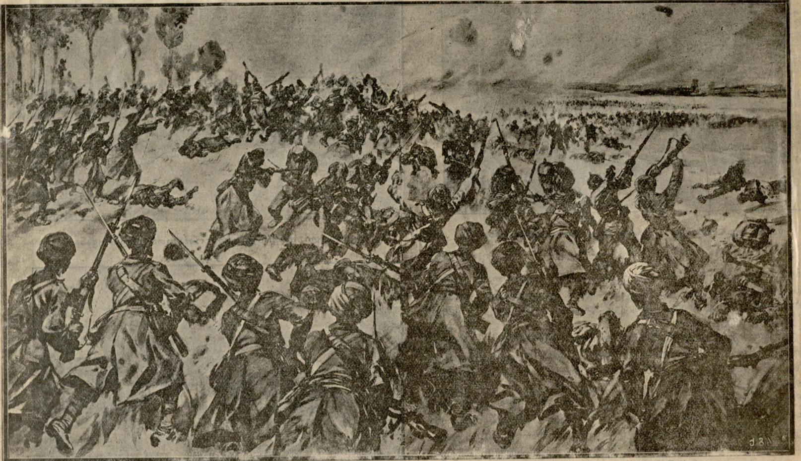
ინგლისელების მეტროპოლიის და ახალშენის ჯარის (ინდოელი სიპაები) იერიში გერმანელებზე.