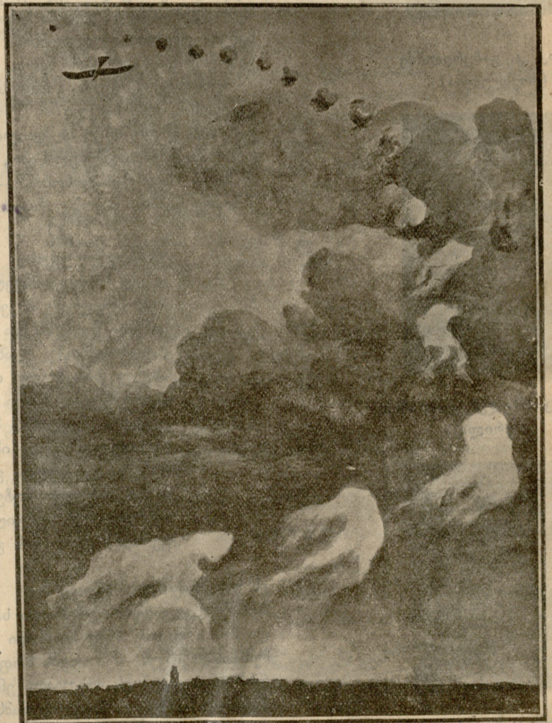
გერმანელების ჰაეროპლანს ესვრიან.

მტრის გამარჯვებულმა არტილერიამ ახლა ნაძენარი გაიხადა მიზნად: საზეიმო შუშხუნებივით სკდებოდა მის თავზე უთვალავი