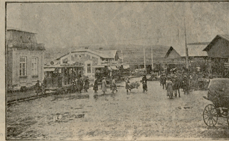
ნავთლული. მძიმედ დაჭრილ მეომართა საკაცეებით გადატანა.

მაგრამ ეს რაა? რად შესდგნენ იგინი ასე უეცრად, როდესაც მათი მოწინავენი თითქმის ზარბაზნის ტუჩს ეხებოდნენ?