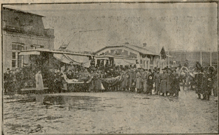
ნავთლული. დაჭრილ ტყვე ოსმალთა გადმოყვანა.

შრაპნელი; მის საზარელ შუშხუნს უერთდებოდა ტყის ლაწა-ლუწი. იქ ჩასაფრებულმა ცხენოსნებმა ველარ გაუძღეს ლითონის წვიმას, სიჩქარით უტიეს გადმოიარეს მდინარე და მის სანაპიროებზე ატეხილს ხვილიფს შეეფარნენ.