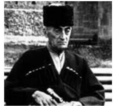
ჩემს შეილიშვილს, პატარა კონსტანტინეს ვუძღვნე