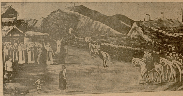
ქორწილი სოფლად.—ნახატი ნ. ფირისმანაშვილისა.