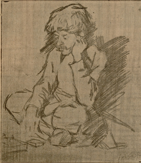
ახალი — ნახტი ხალიხ ბეგ მუსაივისა.