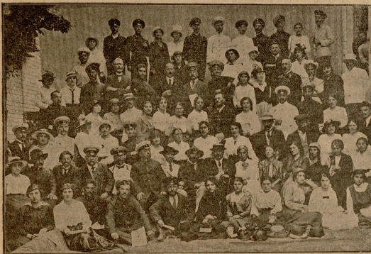
ბვილისს გუბარნიის სახალხო მანფაფაშელთა ჟრილობა.