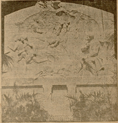
ავიაციის მამამთავრის მარცხედი. (იხ. ლ. გახ.)