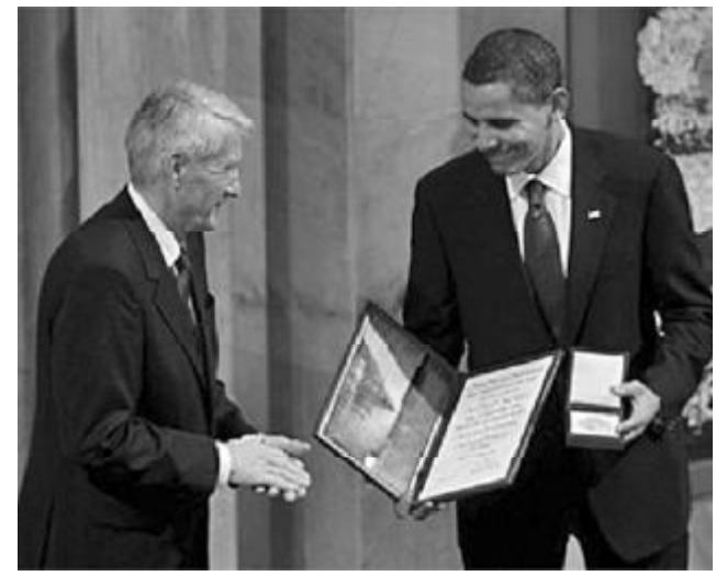
ამერიკის შეერთებული შტატების პრეზიდენტი ბარაკ ობამა მშვიდობის ნობელის პრემიის ლაურეატი 2009 წელს გახდა. ნორვეგიის ნობელის კომიტეტმა ოსლოში მაშინ განაცხადა, რომ პრემია გადაეცა მას ძალისხმევისათვის ბირთვული იარაღის გარეშე მსოფლიოს შექმნისა და ხალხთა შორის თანამშრომლობისათვის.

„ობამას ბევრი მომხრე კი გაოცებული იყო და მიანიშნებდა, რომ ეს რადიკალური შეცდომაა“, – წერს ნიგნში კომიტეტის ექს-მდივანი. და დამატებით აღნიშნავს, რომ ობამა არც აპირებდა ნასუფიუ ოსლოში დაჯილდოების ცერემონიაზე, მისი ადმინისტრაცია კი არკვევდა საკითხს, ხომ არ შეიძლებოდა გვერდი აგვევლო ოსლოში პრემიის გადაცემის ცერემონიისათვის. აღმოჩნდა, რომ ასეთი რამ მხოლოდ იშვიათ შემთხვევებში ხდებოდა – უმთავრესად, თუ პრემიას ანიჭებდნენ ვინმე დისიდენტს, რომელსაც არ უშვებდა საკუთარი ქვეყნის ხელისუფლება.