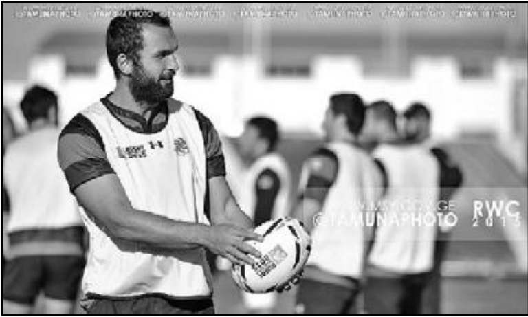
19 სექტემბრის მატჩის შემდგომ სამწვრთნელო შტაბში აღდგენასა და ვიდეოანალიზს დაუთმო დრო და მორაგებები მომავალი მეტო-

ქების თამაშს უფურცდნენ. დღეს ნაკრები იბრძოლებს არგენტინელ პუმებთან, რომელმაც წელს მსოფ-