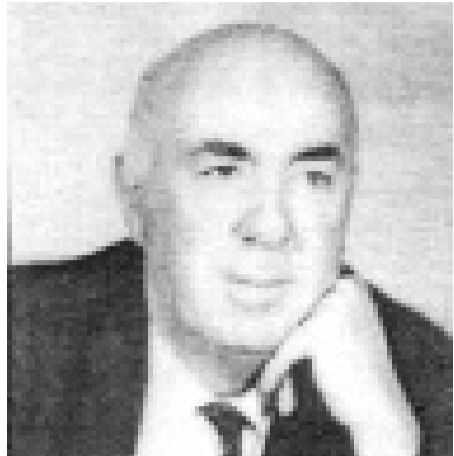
გაგრძელებთ წერილების ციკლის ბეჭდვას

ამაში მოულოდნელი არაფერია, ვინაიდან, იმ ეპოქაში, არათუ რაიმე მნიშვნელოვანი დასახლება, არამედ საგვარეულოც კი, თავის თავს ურად მიიჩნევდა და თავის ეროვნებად თვლიდა იმ კუთხის დასახლებებს, რომლის მკვიდრიც იყო. მით უმეტეს, ეს ტომები, ხშირად, ხანგრძლივად იყვნენ ერთმანეთისგან მოწყვეტილნი და, ალბათ სწორი წარმოდგენა არ ჰქონდათ, არც თავიანთ ვინაობაზე და არც ერთმანეთზე, მაგრამ რადგანაც ბერძნებმა ამ ტომებს დაარქვეს ერთი სახელი – „კოლხები“, ეს კიდევ ერთხელ მეტყველებს იმაზე, რომ ისინი ეგრისის სამეფოს მკვიდრები, ეგრები (მეგრელები) იყვნენ და ბუნებრივია, მათი ენა იყო მეგრული, ან მეგრული ენის ესა თუ ის კილოკავი.