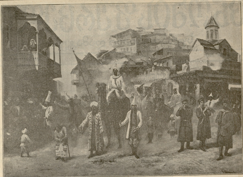
ვერეხა. — სურათი ს. შამშიათისა. ატობება ეჩიხის ფურცლისა.

მეგრე გაშალეს ზღვაზე ანავორები, დასხდნენ ზედ და წაიცილნენ. მაგრამ კაცს ლოცვა შეეშალა, შივა და ზიგ სიტყვები დაიფიქრა. მაშინვე გაეჭანა ზღვისკენ, გაშალა ზედ თავისი ნოხა და გასრიალდა. წმიდანებს რომ მისწვდა, იმით განცვიფრებით ჰკითხეს გარჯის მიზეზი და როცა გაიგეს, უთხრეს: წაიღე, მშაო, ისევ შენებებრად ილოცე: ღმერთს შეუსმენია შენი ვედრება, სასწაულომოქმედობის შნა მოუწიებებია შენთვისაო.