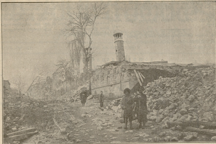
უგანა.—ამჟამად მუქთა და მას ახლა სასაღებო მაწის ძირს შემდეგ, ეკონომიკის ფოტ. აკრატობაა იწინისა ფერდღისა