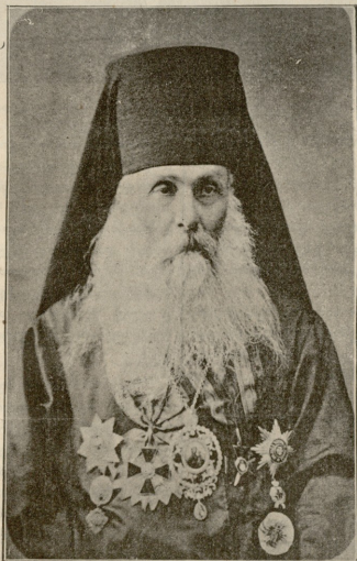
მისი უსამღვეფლოვრობა ეჩიხეობაში აღეჭნანდრე. (შენიშნა იმ ვაჟს, რომლის ფერცელშია)

ამ სერზე, ზედ შუა ადგილის, იყო კვირაცხოველი, რომელიც დიდი ძალ ხალხს იზიდავდა გარშემო სოფლებიდან. მაგრამ ი დალოცვილი საყდარი კი არასადა ჩანდა ორკარებინი; მხოლოდ ყორე რამ იყო ახასებელი ქვებისაგან გაკეთებული, მაცულის ჯადებით და ძეცნარით გარმოდებული, ყორიდან გაოცებული ჯოჯოგები იზორბოდნენ, ქვეში დამფრთხალი ხელიკები დსლიკინებდნენ. შუახე ესენა ხავს მოკიდებულებივე ფიქლის ნაქერი, რომელზედაც კაცის სახე იყო ამოქრილი, მთელი სახე კი არა, მარტო ცალი თვალი ცხვირის ნახევარი და დასწვრივ ცხვირ ტურნიაკაბი. არ ვიცი, საფლავის ქვის ნატები იყო ეს უწინდელი ნაქანდაკები, აკრბის რამ ნაშთი, თუ ქვეზე ამოქრილი ხატის ნამტერევი; მხოლოდ ხალხი დიდ პატივს სცემდა მას, მოწიწებით ედღერებოდა და უფრო მეტ სანთელს უნთებდა, სანამ ვასპატაკებულ ხატს, რომელიც იქვე დღფარნაზე დაესვენებინა ხუცესს.