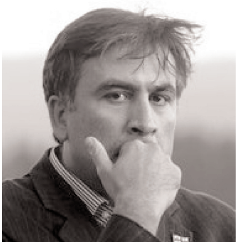
არკანგელის მორიგი ბუნილი, ანუ ბუნი სიხვა კანონი

საქართველოს პრეზიდენტის მიერ ქალაქად გამოცხადებული ანაკლია ჯერ კიდევ სოფელია. მიმდინარე წლის 22 ივლისს გავრცელებული ინფორმაციის მიხედვით, სოფლების – ანაკლიისა და განმუხურის – გაერთიანების შემდეგ მას საკურორტო ქალაქის სტატუსი მიენიჭა, თუმცა განმუხურსაც და ანაკლიასაც ისევე სოფლის რწმუნებულები მართავენ. მათ ამის შესახებ ჩვენთან საუბარში თავად განაცხადეს.