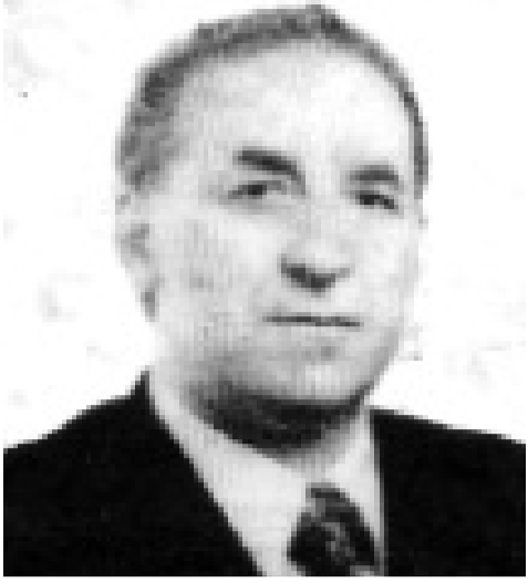
დასაწყისი "ილორი" №171-195

ამრიგად (ზოგიერთ საკითხს ვიმეორებთ): მითის მიხედვით იასონმა იმოგზაურა კოლხეთში „ოქროს საწმისის“ მოსაპოვებლად. ოდისევსმა თანამხლებთან ერთად იმოგზაურა ლამაზთმიან გრძელ კირკესთან კუნძულ ეაში (ხმელთაშუა ზღვა). მისი მეორე სახელია ცირცვია. ცირცვია ხომ არ არის მეგრული სიტყვა „ცირას“ – ქალიშვილის – ასულის გამომხატველი სიტყვა? კირკეს – ცირცვია, ცირა არის მზის ღმერთის ჰელიოსისა და პესეიდას ქალიშვილი. კოლხეთის მეფე აიეტის კუნძულზე ოდისევსმა წელიწადზე მეტი დაჰყო და კირკეს – ცირცვა-ცირას, მისგან შეეძინა შვილი ტელეგონი. ე. ი. მედეა მზის ძე აიეტის ასულია, კირკეს, ცირცვას მამიდაშვილი. ხოლო აიეტის მეორე ქალიშვილი მედეას უფროსი და ქალკოპე ფრიქსეს მეუღლეა. კოლხეთში ოქროსთმიანი ვერძით მიმავალი ფრიქსე, როგორც ზემოთაც აღინიშნა, გადარჩა, მისი და პელე ზღვაში ჩაყარდა და დაიღუპა, რომელ ადგილსაც პელე – პელესპონტი (თანამედროვე დარდანელის სრუტე) უწოდებს. კოლხეთში ჩაფრენილი ფრიქსე აიეტმა თავის ქალიშვილ ქალკოპეზე დააქორწინა. ფრიქსე და პელე ქალაქ ოქრომენის მეფის ათამასის და ღრუბლების ქალღმერთის ნეფელეს შვილებია. ათამასი (ათამასი) გახცილდა მეუღლეს (ნეფელეს) და შერთო ქალაქ თებეს მეფის კადმოსის ასული ინო. ინომ შეიძულა გერი შვილები ფრიქსე და პელე. ისინი სწორედ დედინაცვალს გამოეპყენე კოლხეთში.