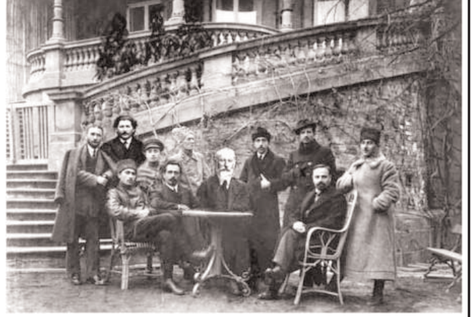
ვთქვით, ბევრ მათგანთან გვერდ-ზე დგომა თქვენთვის დამამცირებელია...