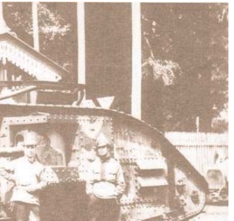
ახლა მე ვეკითხები საქართველოს დღევანდელ მოლაპატრულ ხელისუფლებას...