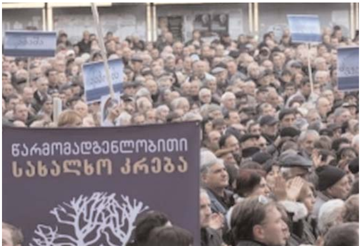
ნებსში გამარჯვება, ეს მთელი ერის სირცხვილი იქნება. ღმერთმა დაიფაროს და ბატონი ბიძინა წარუმატებლობა მარტო მისი კი არა მთელი ერის დამარცხება და შედეგად, ალბათ, კიდევ 15-20 წელი დასამარბულები ვიქნებით. აი, ასეთი დიდი

– ბიძინა ივანიშვილმა, რა თქმა უნდა, გამოაცოცხლა საქართველოში პოლიტიკური ვითარება. გაიხსენეთ, 26 მაისის შემდეგ, როცა სისხლში ჩაახშეს ყველაფერი, გამარჯვებულად თვლიდნენ თავს. როგორი კაბალური კანონები მიიღეს, ხმის ამომღები აღარაფერი იყო დარჩენილი. შანსიც თითქოს აღარავის ჰქონდა. ახლა ერთობაა საჭირო, მხოლოდ იმისთვის კი არა მიშა გადავადოთ და გრძობა მოვიფიქროთ. მხოლოდ ეს არ არის ქვეყნის გადარჩენა. ერთმნიშვნელოვნად, მიშა უნდა მოშორდეს ხელისუფლებას და ხალხმა აირჩიოს ის ადამიანი, რომლებიც დაიწყებენ სახელმწიფოს მშენებლობას ქვეყნის განვითარების ეტაპები მომავლის საქმეა, მთავარია, ხალხს მივცეთ თავისუფალი არჩევანის საშუალება, ხოლო დეტალებზე კამათი მომავლისთვის უნდა გადავდოთ. დამოუკიდებლობის გამოცხადებიდან აქერ 21 წელი გავიდა, მაგრამ, ჩვენ და სამწუხაროდ, ამ ხნის განმავლობაში სახელმწიფოს მშენებლობისთვის ერთი ნაბიჯიც არ გადაგვიდგამს, მხოლოდ სახელები შევუცვალეთ – ცეკას პირველ მდივანს პრეზიდენტი დავარქვით, მილიციას პოლიცია, რაიკომის მდივანს – გამგებელი,