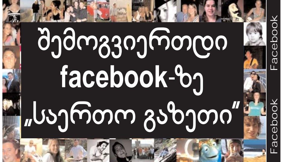
შემოგვიერთდით facebook-ზე „საერთო გაზეთი“

მე მრცხენია, რომ თქვენ დღემდე განაგრძობთ ხალხის ზომბირებას, რუსთავე 2 - ისა და „იმედის“ საშუალებით! მე მრცხენია ბატონო პრეზიდენტო, რომ თქვენ, კიდევ წელიწადი და რამდენიმე თვე უნდა იყოს ჩემი პრეზიდენტი! ამიტომ აქედანვე შემოგითვლით მშვიდობით, ბატონო პრეზიდენტო!