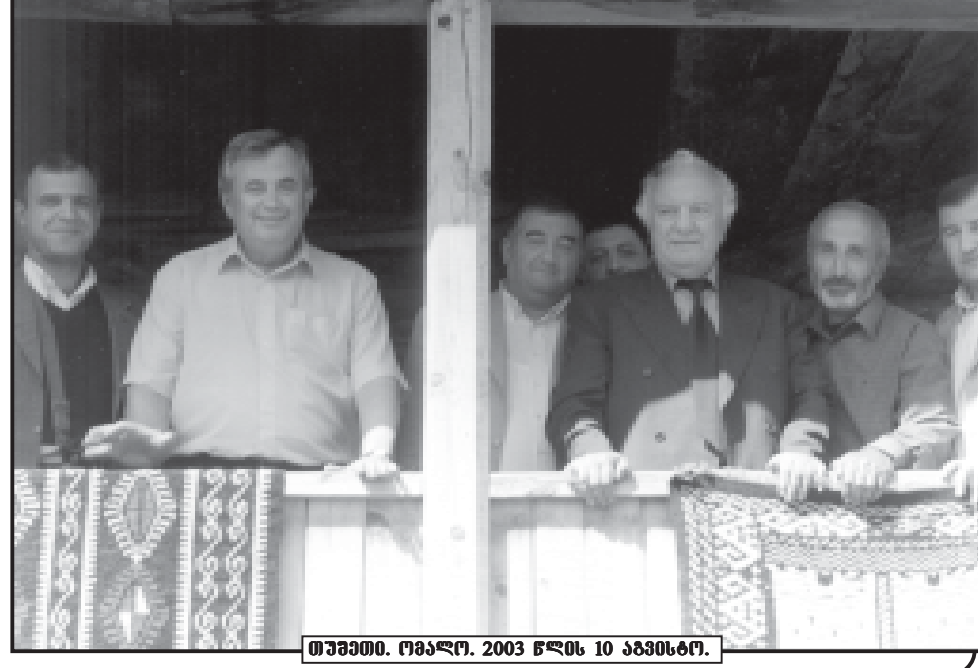
თურქეთი, ოგაღ. 2003 წლის 10 აპრილი.