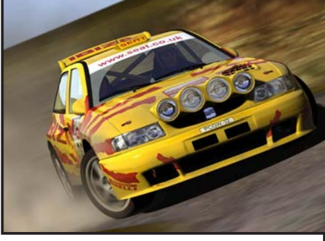
მომხდელი სპორტი (საქართველო, Iada-Samara)...