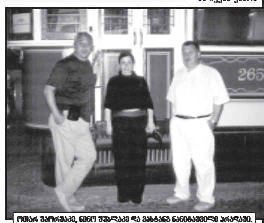
ქალბატონი, რომელიც ახლა სასამართლო პროცესშია.