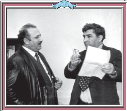
ნაპოლეონი სოკრატ ხალუკვაძე და არტიტორი, საბჭოთა კავშირის გენერალი, პრიფესორი ირაკლი ციციშვილი. გადაღებულია 1979 წელს.