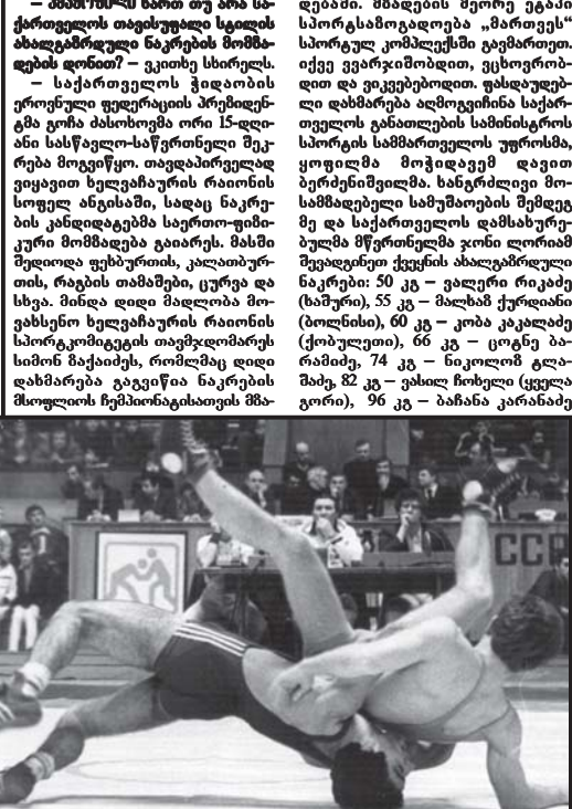
ბასსუმი კვირის განმარტობაში... ბასსუმი კვირის განმარტობაში...