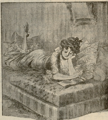
— ამ წაგნში მოთხრობალია, რომ ქმრის მოღალატე დასაკუო, სიდრეს სწურენ: რატომ შე არ დაუისჯე.

სარიდან კოტა ხნით შეტერდა, გაიმართა წელში, მარცხენა ხელი შემოიღდა წელზე, აიჩქა თმები, დიდრინი შავი მოციწინარე თვალები გადააუღო თავის მოჯრბო არწივისებურ ცხვირს, მერმე შეხედა ყარამანს, რომ უფრო შობაბედილება მოხედინა, დააჩერდა მას, ასწია მარჯვენა ხელი მაღლა და ხმა-გაქიანურებულად, თითის ქნევით განაგრძო:—მე ვბაიჯობ სამას სამოცდა ხუთ კაცს ჩემ სახლში, ჩემ სოფელ-