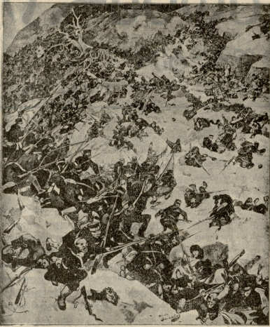
გინის რაიონის მთები.

სტანჯავდა და ატირებდა ცოლს. ერთხელ გადაწყვიტა კიდევაც მიტოვებოდა სახლკარი და წასულიყო სადღე, თხოვნა გაგზავნა, ჩაგრობა ითხოვა და გაჯავრებული წასახა ცოლს: