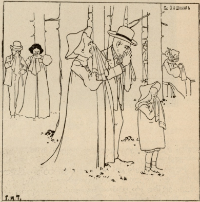
ბაღ მანგლისში. შოაკარაკენი ისრბობის სიმურადისუგან.