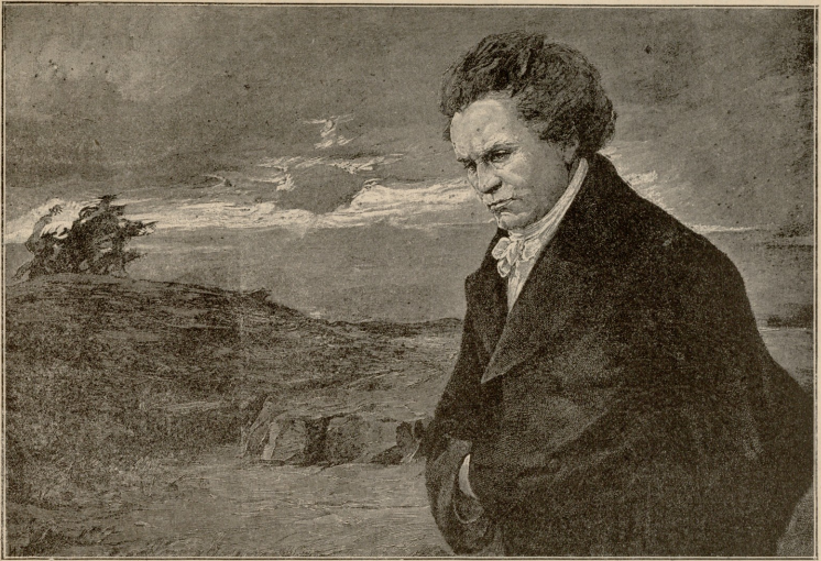
ბეთაჟაგენა, კამონენაღა კომპოზიტორი — სურათი კუაფისა.

ქალეზო! ეხლა თუ აგრე სჯით, რას იტყვით მაშინ, როცა დათხოვდებით?