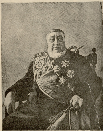
ახლად კარდაცხლებული პაპუს კანონმდინი (ტანსეალოს ყოფილი პრეზიდენტი)

ბინა მოვეცეს. თვითონ ბოილოვსკი იმ ყვამდ პარხში სცხოვრობდა და ჩენ მივიღო მორჩაგმა, კახიშირ სპრინსკიმ. არ გასულა ერთი საათი, რომ