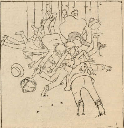
მანგლისის შოაკარაკეთა გარბობა: სოკოების ძუნსა და მოტყება.