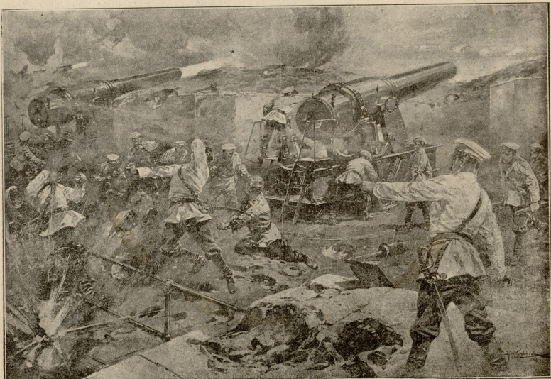
ბნობლა ზარბაზნის. რუსების ბატარია.

ოდესღაც იაგორა თავისუფალი იყო. იგი სცხოვრობდა თავისთვის კურსის გუბერნიის რომელიღაც სოფელში. მოხუცი დედის მეტი არაფერი გაჩნდა. ნახევრად ჩამონგრეული ქობი დღეს-ხვალ სრულებით დაქვევს ლამობდა. მეტის-მეტ უკიდურეს გაჭირვებაში იყვნენ. თითონ იაგორას საკუთარი ცხენი არა ჰყავდა და ძილუბებული იყო სხეფთან დღიურად ემუშავნა, რომ მერე თავისი მიწებიც სხვის დახმარებით მოეხნა. ამასთან იაგორა არცის მწყალობელიც იყო: უყვარდა გადაცერა და შფოთი. მთელს სოფელში ყველას თავი ჰქონდა მომებრებული იმისგან. მთელ სოფელში იაგორაზე ღარბი