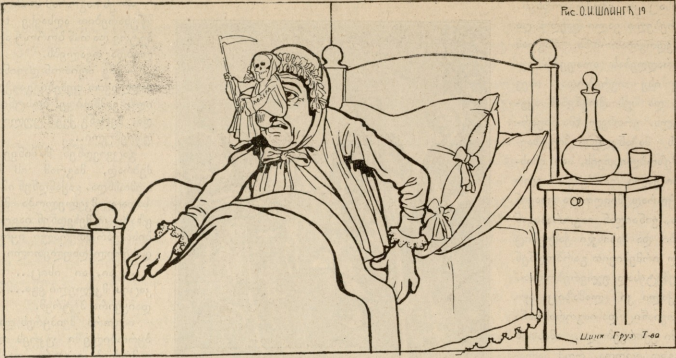
ტფილისის გამგებამ შიშობად სხვა კავადობა და შეუდგა ქალაქის ვითომ და დასუფთავებას.