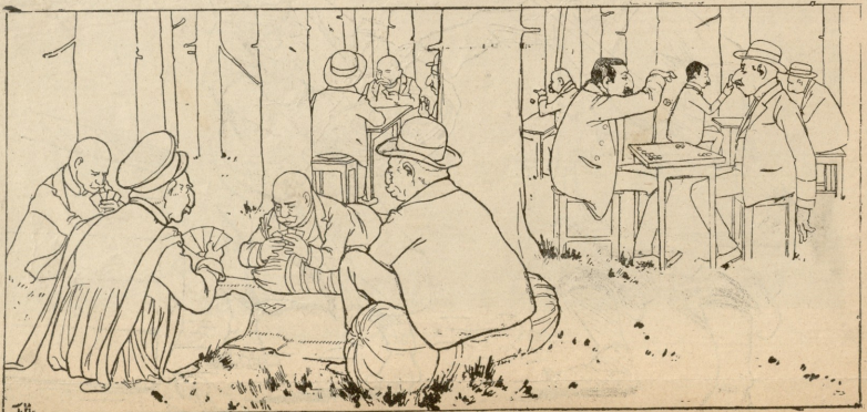
სეფი აჯარაქები. - მხატვრული.