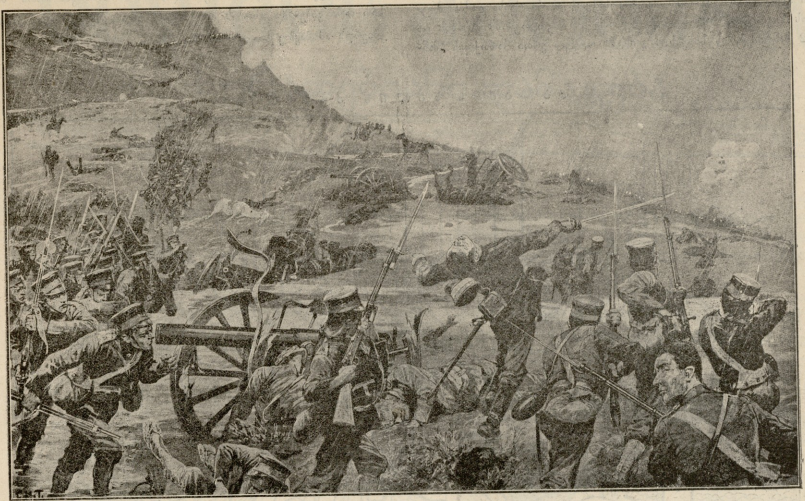
აბონელთა ბანაკი.—ბრძოლა ცაიხაუსთან, წვიმის დროს.

ურჩობა?... სურათის გადაღება მაინც გეცლია, შენ არ-დასა-კალბებელი...—ვთუ შენ გენაცვალე, შეილო, ჩემო სტუდენტო!—შეგვივლა უცებ თეკომ და გაუშვა ხელი ლენს. კარგში გამოჩნდა სტუდენტის ფორმაში გამოწყობილი კალი-სტრატე. ხელები გზიბეში ჩაქუცო და ილინებოდა.