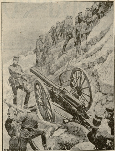
აპანელები მთაზე მათარევე წარბასუნეს ჰაზიციას ეასმარებულად