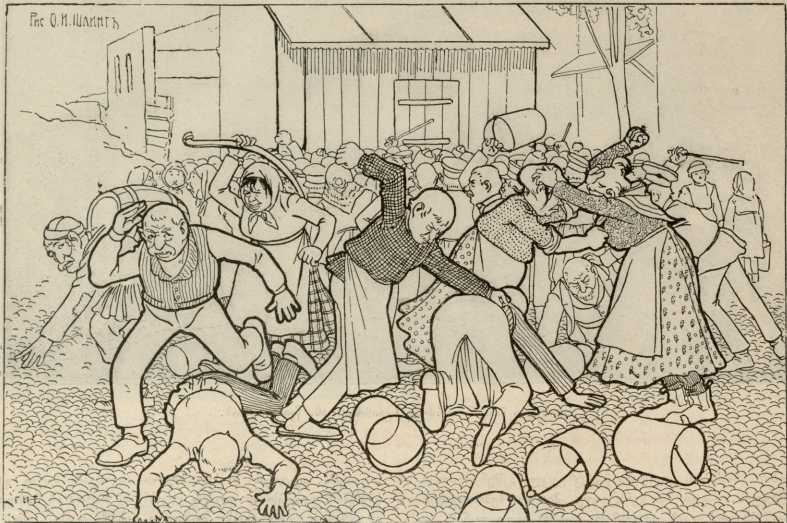
წარმოიდგინეთ, მთელი ეს ჩხუბი და ალაქოთი ერთი ვედრა წყლის საშოვრადაა ატეხილი!...