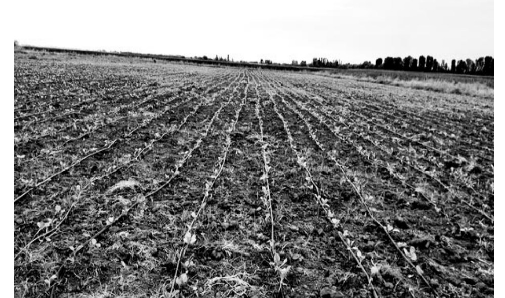
შეხვედრაზე, დაინტერესებულმა მოსახლეობამ, ფერმერულმა კოოპერატივებმა სარწყავი და სასათბურე სისტემების შესახებ მიიღეს ინფორმაცია, მსოფლიოში ერთ-ერთი ლიდერი კომპანიის NETAFIM-გან. რომელიც წვეთოვანი ირიგაციის მსოფლიო ინიციატორია. მათი წარმომადგენლობა 110 ქვეყანაშია.

სოფლის მეურნეობა სახელწიფოს განსაკუთრებული მხარდაჭერისა და ზრუნვის ობიექტს წარმოადგენს. ხორციელდება მთელი რიგი ხელშეწყობის პროგრამები, რომელიც ფერმერსაც და გლეხსაც ერთნაირად აძლევს განვითარების და მაღალი მოსავლის მიღების შესაძლებლობას ნაკლები ფინანსური დანახარჯით. მოსახლეობასთან აქტიურად მიმდინარეობს ინფორმაციული სახის კონსულტაციები, რაც მათ აძლევს სწორ ორიენტირს, თუ როგორ დაგეგმონ თავიანთი კოოპერატიული თუ წვრილი გლეხური მეურნეობა. არსებობენ ქართული და საერთაშორისო ორგანიზაციები, რომლებიც სახელმწიფოსთან თანამშრომლობით, ახორციელებენ სხვადასხვა პროგრამებს, მოსახლეობას უწევენ კონსულტაციებს და ესმარებათ სწორად, თანმიმდევრულად დაგეგმონ და განავითარონ სოფლის მეურნეობის მათთვის სასურველი დარგი. მოსახლეობასთან ამ უწყვეტ კავშირს, სოფლის მეურნეობის სამინისტროს ხაშურის საინფორმაციო-საკონსულტაციო სამსახური უწევს კოორდინირებას. 7 აგვისტოს გამართული