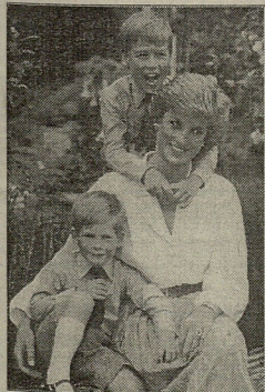
ინგლისის საბავშვო აღზარდული პირინცები