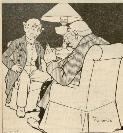
— თქვენი პოლიტიკური რწმენა მაინც ვერ გამოიჩინევი! რომე-ლის მიმართულებას მომბეზო ხარო? — საკვირველი გამოუცდელი ყვიფილხანთი ჩემი რწმენა დამოკლე-ბულია იმზე, თუ ვის ველაპარაკებ: ავტონომისტთან — ავტონომისტ ვარ, სოციალდემოკრატთან — სოციალდემოკრატ ვარ; ფედერალისტთან — ფედერა-ლისტი და მონარქისტთან — მონარქისტ ვარ; წარმოადგინე, ანარქისტს შე-ვიტყვი, თუ ანარქისტთან შეშვდა ლაპარაკი.