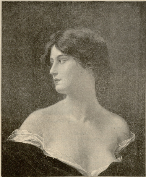
პორტრეტი. — სურათი რინდელის.

— მე შენთვის ბედნიერება მსურს, — უთხრა ქალმა.