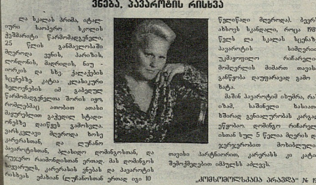
ახალი რეპარატი - მოთხოვნის სიზარტული, პარკისის...