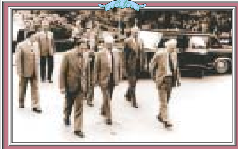
ბმზარქმწმ, სამოცდაათიანი წლების ბოლო (მარცხნიდან): საქართველოს მინისტრთა საბჭოს თავმჯდომარე შარბ პატარაიძე, საბჭოთა კავშირის მინისტრთა საბჭოს თავმჯდომარე ალექსი კოსიკინი, ელვარდ შევარდნაძე.

შეგახსენებთ, რომ სურათების გამოქვეყნება უფასოა. ტელ: 99-66-10. ფოტოების მოწოდებელი ვიზიტი, რომ დაბეჭდვადან ერთი კვირის ვადაში მოაკითხონ რედაქციას გამოქვეყნებული სურათების წასაღებად.