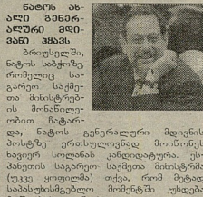
ნანოს ანალიზი ბინები აღიზინებენ

17 დეკემბერი — რუსეთის კეთილდღეობის არჩევანი. დანარჩენი მსოფლიო თვალყურის აღევნებს და ელოდება შედეგებს, რომელიც მტყანალებად განსაზღვრავს მათი ცხოვრების წესს.