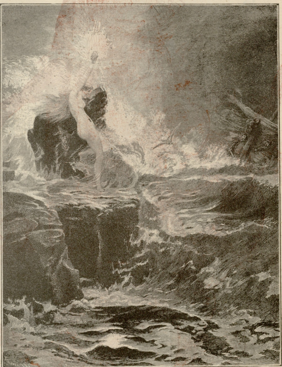
ზინათლიხაკენ. — სურათი ფელდენისა

— ცხელი და კიდევ ცხელი! — მწუხარედ წამოიძახა მომდგარმა. — ნუ თუ შენ, რომელმაც დამიბოროლე შეფენი სურვილი და დავის მსგავსად ატყვე თვით რისხვით მტრევიანი ვერსიო-კი, ეგრე დამიბოროლე გე გული!