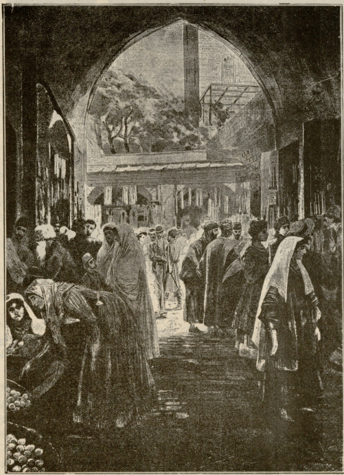
აერუსალიმის ქუჩა მავსოვარის სასაფლაოსთან აღდგომა დღეს.

რეტ-დახმები ქალი გონს მოეგო. წელში გასწორდა, ბროლის მკვლელები განიპყრო და მდვარის ხმით დიძახა: „განათლიდ, განათლიდ, ახლო იერუსალიმ, რამეთუ ძე შენი აღდგომოდ არს მკვდრეთით!“