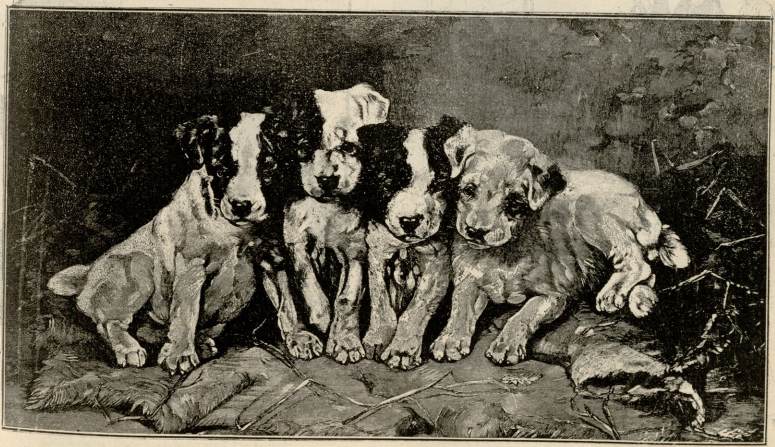
ფოტოგრაფიონს. — არ გაუხმარეო... — სურათი დიდაან შეგითას.