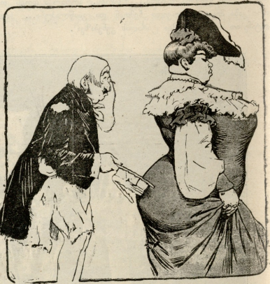
— ეღეწე, ნუ თუ გრომსიც არ მანწეებ მე, რომეღმაც რე ათის იწუმბი გაღაკაბე?!

რესტორანში. მიხანდრეს ამავი. 1. დივანზე მწეჭანი იხეი. ასე დეუმიზნე თიფი, გესროლე და 2. ჩემ ძაღლს ვუთხარ, „ჰიღ“ 3. ტრწსორა გაჭანს და მწეწეიერი იხეი მომბიტანს.