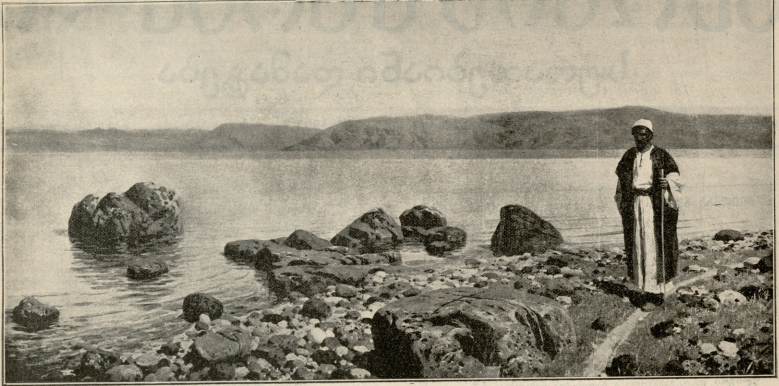
გენსარეთის ტბაზე.—სურათი ზღაწეონისა.

გრაგორაგა. ზღაწეონს და კალიშეშა. თბილი ქუდი ჭურავს და ხელთათმუნბა ჰქვს გაკეობული. ხელში სურნაის ჩასადება უჭირავს.