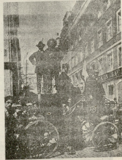
პორტუგალიის ჩამოღუპილი: მონარქისტთა ჯარები მიახლოდუნენ!

მე ცხოვრებაში გამოუცდელსა წილად მხელა ჯაფა და გაქირვება, და თავს გადამხდა გადაუხდელსა ბევრი სირცხვილი, თავ დამკირება.