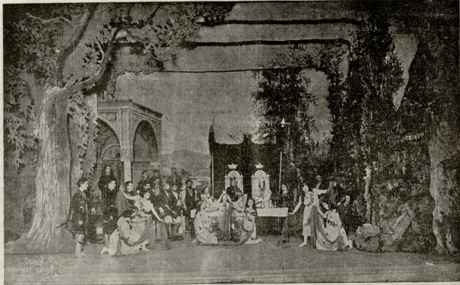
ი. გვედევანიშვილის პიესა „სინათლე“. სურათი პირველი: მუფის ჯინშერთა ლიზი და უფროების ცეცხლ.

ოქრომკვერდელმა რო ნახა, მისი ეტლი ვერ გაივლის, თუ ურემი გვერდზე არ მისწვიეს, გული მოუვალა, გაბრაზდა და თავის მონას, მგავლუტას უბრძანა, გვერდზე მისწვიე ურემი, რო ჩემმა ეტლმა გაიაროსო. მეურმე ურემის მიწვივის ნებას არ აძლევდა, რადგან ურემი ბრამის პირას იყო გაჩერებული, ხელი რო ეხლოთ, იქნებ ბრამში დაღაჩნებოდა. მაგრამ ბრამინმა მეურმეს ყურიც არ ათხოვა და მონას უბძანა, რაც გითხარ, ასწრულყო. მკლავ-ლონიერობა მგავლუტამ, რომლისათვისაც სიაზოვნებმა იყო სხვისი დაზავება, ასწრულა ბატონის ბრძანება და, ვიდრე ბერი მეურმეს გამოესაჩუქებოდა, ურემი გვერდზე გადავლო. პანდუ გზას გაუღდა. ბერი გადმოხტა ეტლიდან და უთხრა: