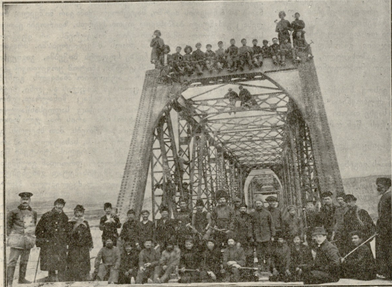
კახეთის რკინის გზა. ხალი იორზე.

სალაპი შენდა, უღაბნოს ქალი! როდესაც ვანთაილ ამობრწყინდება და ნისლს გაჭვანტვის მთის მწვერვალზე ცეკვი ნიაჭი, როდესაც ვაიშლება დროშა გრძობისა და სიყვარულისა, ამ დროს რომ შეუქნნეგლად შემოახედოს შენს ოთახში მიშოზამ, მოესმება წარუღელი კოჩნა? არ ეჩვივი შენს მეუღლეს, ვით სერო ზის გარემო? რომლისთვისაც დასტოვე ქალაქი და გააქვე შორს უღაბნოში