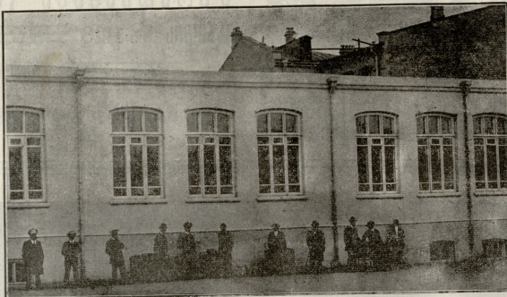
წ. კ. გ. საზოგადოების ბაქოს ქართული სკოლა.