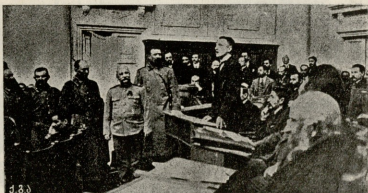
დეპუტატ კერენსკის განდევნა სათაბიროს დარბაზიდან. კათოღარბუ სდგას და ლაპარაკობს ა. კერენსკი, მის წინ კი დამცველ განყოფილების უფროსი როსტენ-საკეინი.