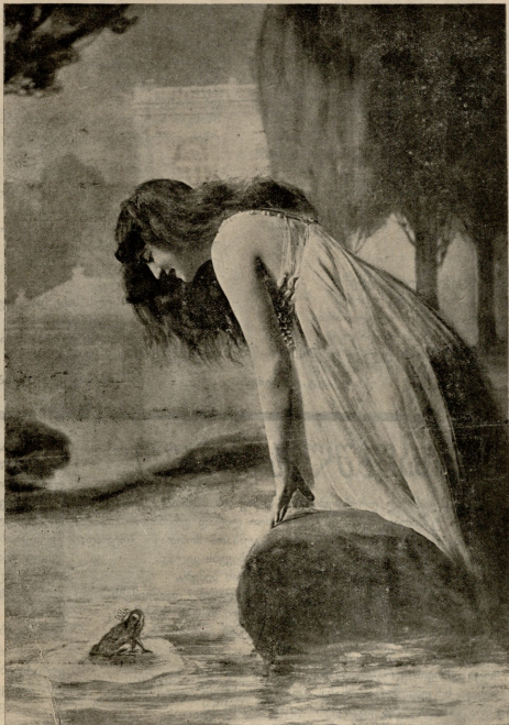
გვირგვინისანი ბაყაყი—მეფის ასული. (ხლაპარი).