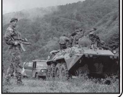
სამხედრო მსახურის მსრულებლები.

„წარმატებით ეუფლებიან სამხედრო ხელფასებს“ - ამის შესახებ განაცხადდა საქართველოს თავდაცვის სამინისტროს მიერ. მხედრობის მსახურის მსრულებლებს ხელფასების გაზრდა განიხილეს.