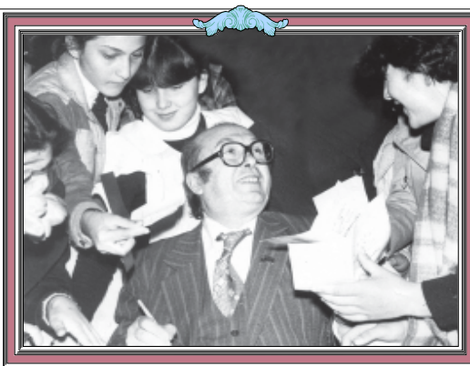
2003 წლის ნოემბერში ნორმ შემოქმედებამ შეხვედრას. სურათი მოგვითხროს ნორმ ქაბახაძის. შეჯამება, რომ სურათების გამოქვეყნება უფასოა. ტელ: 99-66-10.