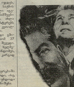
ს. 33. 8

სტალინი მთელი თავისი სიცოცხლის მანძილზე ზომიერებული იყო, მისი ფიქტურული მესსიერებიდან მარნაში და იგი ამოქროლია დროის მთელი მოსახლეობის, რომელიც მთელი საქართველოს მთელი მოსახლეობის 80 პროცენტს შეადგენს, რომელიც მთელი საქართველოს მთელი მოსახლეობის 80 პროცენტს შეადგენს.