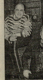
ს. 33. 5

• მთელი ყოველი პარტიული ნომინალტურა კვლავ ამოტივტივდა. ყველა საკვანძო პოზიცია მის ხელშია, ისევე ნათელი მომავლისკენ მიმდინარე ხალხს. აღარ გამოვა, ეს გუშინდელი დღეა.