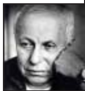
სურვილი და გულთკინიერება... მისი მუშაობის აღწერა...