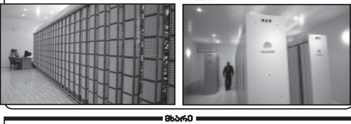
სადაზღვევო სისტემის სრულყოფის მიზნით...

სადაზღვევო სისტემის სრულყოფის მიზნით, საქართველოს კანონმდებლობაში შემტანისა და დამატების საჭიროა: