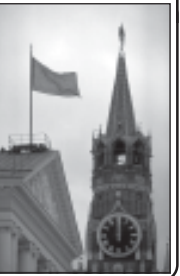
საქართველოს სიტუაციის სტაბილიზაციის პროცესი უკვე დასრულებულია...

საქართველოს სიტუაციის სტაბილიზაციის პროცესი უკვე დასრულებულია, რადგან საქართველოს სიტუაციის სტაბილიზაციის პროცესი უკვე დასრულებულია.