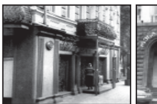
კვირბერილი და უკვირობი... მთელი წელიწადი მთელი წელიწადი...