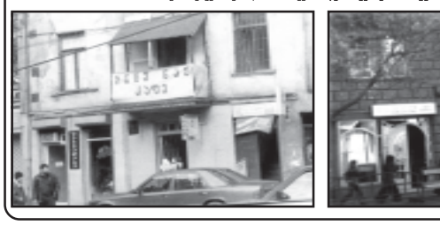
ზუსტად ნიშნავს ზილვა ღარიანილი აზიანი