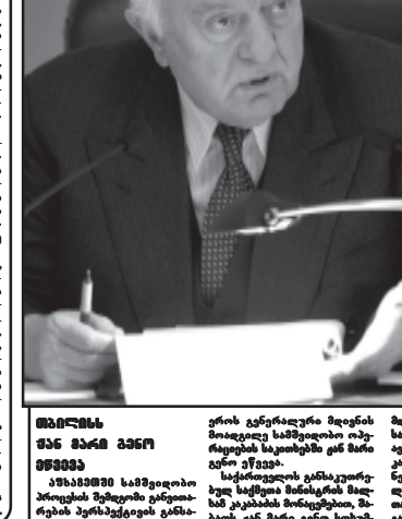
საქართველოს საპრეზიდენტო არჩევნების პროცესი უკვე დასრულებულია...

საქართველოს საპრეზიდენტო არჩევნების პროცესი უკვე დასრულებულია, რადგან საქართველოს საპრეზიდენტო არჩევნების პროცესი უკვე დასრულებულია.