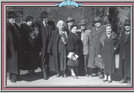
საქართველოში ნაყო კლასიკული, კლასიკული და ლათინური ჯაზის სახსოვარი... მადიე აქეს სახსოვარი...