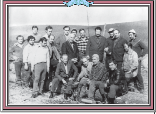
საპირფარეო სამსახურში მუშაობის შემდეგ მუშაობის დასრულების შემდეგ... ეკვლას რაიდე აქვს სახსოვარი