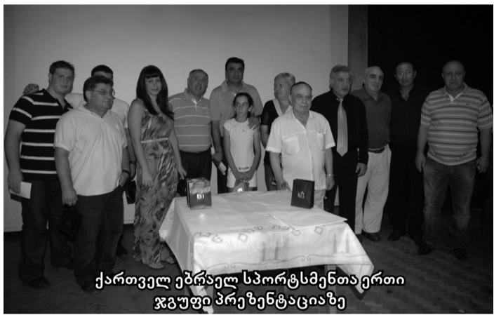
ქართველ ებრაელ სპორტსმენთაერთი ჯგუფი პრეზენტაციაზე

სალამოზე ყოველი გამომსვლელის სიტყვაში უდიდესი მადლიერების გრძნობა